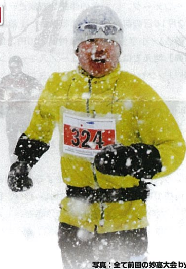
写真: 全て前回の妙高大会 by Shigeru Sudo